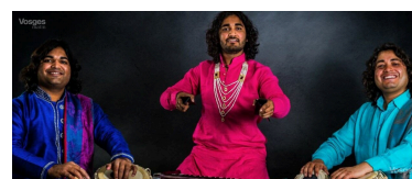
Le Rajasthan Express est composé de trois frères.

Billetterie à l'Office de tourisme de Fraize au 03 29 50 43 75 ou 06 79 40 84 88 ou Jean-Paul Houvion au 06 85 95 89 32. houvion.jean-paul@wanadoo.fr Tarifs : 12 euros à la réservation et 15 euros le jour du concert. ■