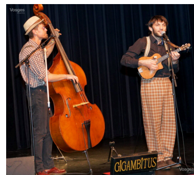
Contrebasse et ukulélé étaient à l'honneur.

Quelques chiffres des JM France : 1 000 bénévoles, 400 partenaires culturels, 2 000 spectacles et ateliers, 150 artistes, 350 000 spectateurs ■