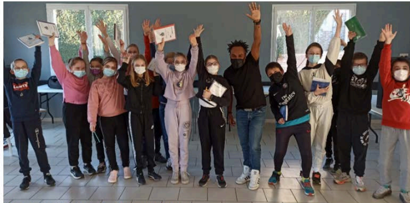
L'artiste est venu jusqu'aux enfants pour leur délivrer un message de tolérance.