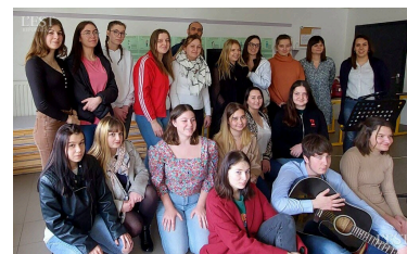
Deux classes de terminale professionnelle ont bénéficié de ce projet culturel.