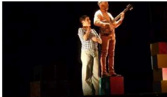
Le duo a captivé les enfants âgés de 4 à 7 ans. SERGE TACHON

Le spectacle choisi à l'intention des classes de maternelle et de cours préparatoire s'intitule « Sur la nappe ». Deux musiciens sur scène jouent de la guitare, du banjo et chantent des histoires de sucre, de pique-nique, de bonbons, de chien qui mange de drôles de choses... Le but est de plonger dans l'univers des tout-petits, avec tout ce qu'il comporte d'imaginaire coloré et gustatif : ce qu'on mange, ce qu'on met