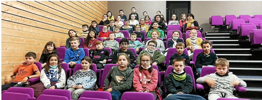
Les CE2, CM1 et CM2 de l'école Sainte-Famille étaient réunis à l'espace Kan ar Mor pour le spectacle Youkali.

Il a emporté les élèves dans un univers poétique et imaginaire, plein de tendresse et de surprises où la musique a été la clé de l'imaginaire. ■