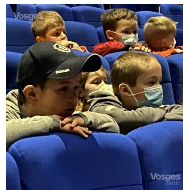
Les élèves très attentifs aux styles musicaux.

Les enfants ont pu découvrir le Ukulélé et la contrebasse ainsi que l'ambitus qui les sépare. Ce spectacle comportait beaucoup d'humour et montrait la virtuosité des musiciens dans tous les registres et styles musicaux, ainsi que de nombreuses possibilités de jeux offertes par chacun des instruments. ■