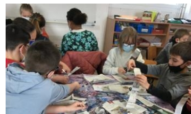
Les élèves de l'école Sainte-Victoire du Clion en effervescence autour de la création des chars du carnaval.

Enfin, les écoles seront conviées à deux spectacles au Val-Saint-Martin : Cinéklank et Eugénio. ■