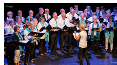
La chorale de Neufchâteau, Accroch'Notes, ouvrira le festival ce vendredi 11 mars. Au total, une soixantaine de choristes feront vibrer le centre culturel jusqu'au dimanche 13 mars.

trois chœurs : L'Écho du Campanile (Vesoul), L'Écho des Coulichots (Aillevillers), L'Écho du Val de joie (Le Val-d'Ajol) – et Chor'Hommes (Ardennes). ■