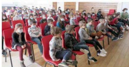
Le jeune public a apprécié cette odysée vers l'Amazonie à vol d'oiseau

lis transportent le public dans un ailleurs vibrant, au fil des illustrations colorées des peintres Adelina et Wozniak. De quoi chatouiller délicieusement les oreilles et les yeux du jeune public.