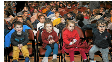
Les écoliers prenant place en attendant le lever de rideau.