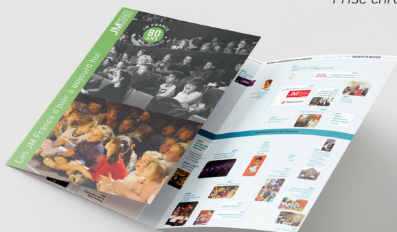
Frise chronologique (A4)

Les 80 ans d'existence des JM France synthétisés sous forme de frise chronologique.