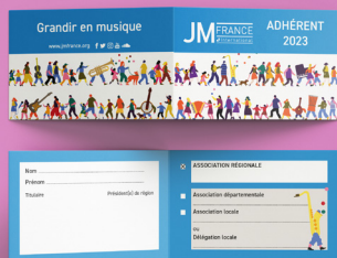
Carte d'adhérent - 8,5x5,5 cm plié