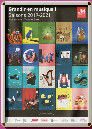
Affiche mosaïque (A3)