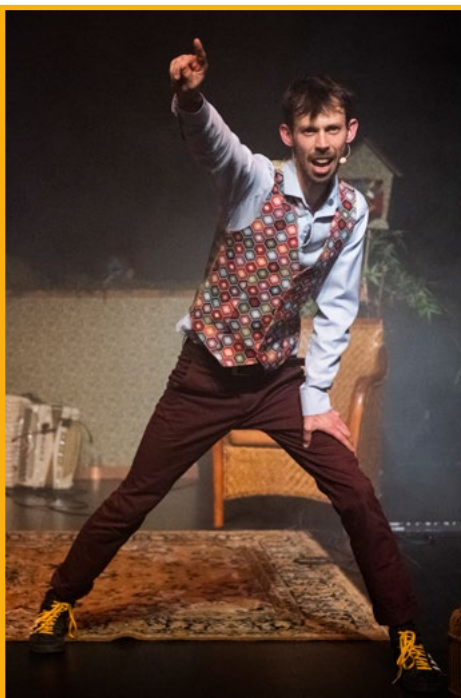
Marin chant, claviers, accordéon, percussions et composition