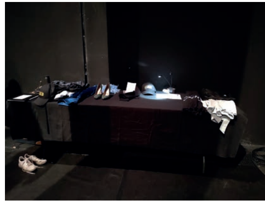
Table coulisse cour