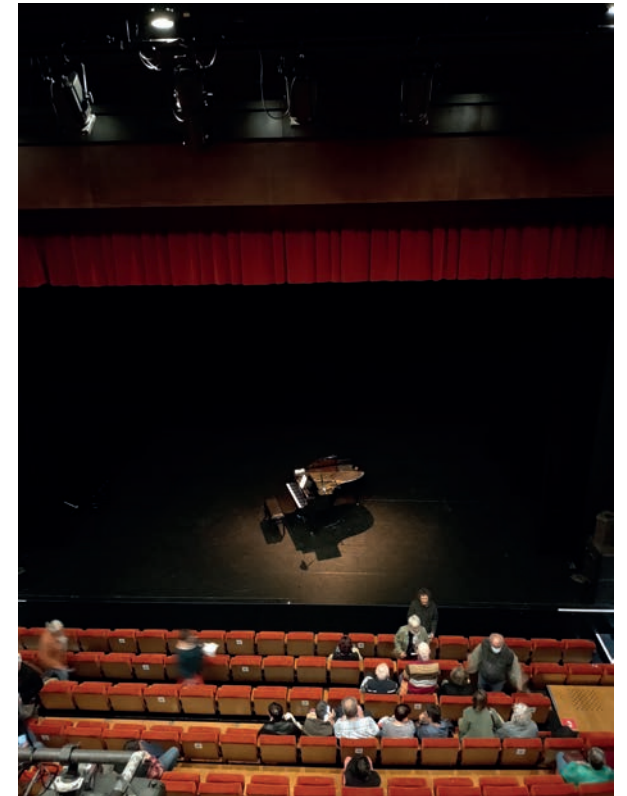
mise piano 3