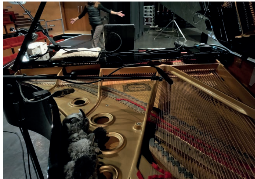
mise piano 2