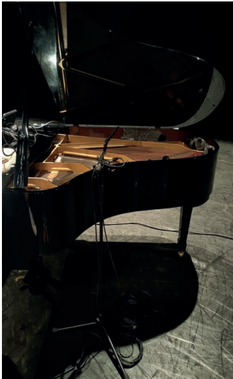
mise piano 1