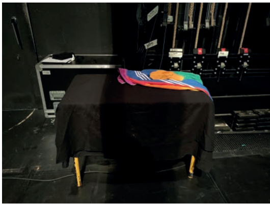
Table coulisse jardin