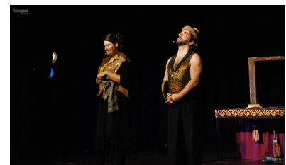
Les JMF reviennent en mai prochain pour leur ultime présentation culturelle de 2024.

D'autant que le cinéma vittellois offre un cadre idéal aussi bien pour le jeune public que pour les artistes, bien heureux de se produire dans la cité thermale. « Nous savons que si nous sommes un jour en manque de bénévoles, il sera toujours possible d'en trouver dans la ville. Il n'y a plus qu'à espérer que cela dure le plus longtemps possible. » D'autant que cette année 2024 marque le retour d'un format qui n'avait plus vu le jour depuis 2018. Le 14 mai prochain, l'association culturelle revient avec son célèbre Tout Public qui proposera deux séances pour les élèves avant d'offrir une ultime performance pour cette année le soir même. ■