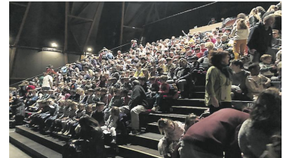
Des gradins bien garnis mardi dernier au Dôme de Gascogne.