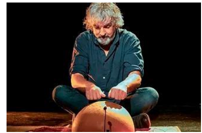
Le berger des sons