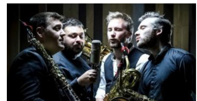
Le Quatuor Morphing se produira à la salle des concerts du Mans.

Mardi 19 mars, à 18 h 30, à la salle des concerts (médiathèque Aragon), 58, rue du Port, au Mans. Tarifs : plein, 11 € ; réduit, 6 €. Réservations : tél. 06 75 43 00 48. ■