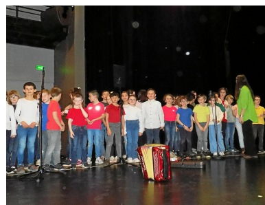
Les enfants répètent avec leur professeur de musique avant la représentation.

L'association ne s'arrête pas là et propose cinq concerts par an pour tous les cycles entre la maternelle et le CM2. Le but premier étant d'ouvrir le spectacle vivant à tous les enfants, afin qu'ils puissent participer à une quinzaine de concerts tout au long de leur scolarité. Le prochain aura lieu au mois de mai et sera consacré aux maternelles. ■