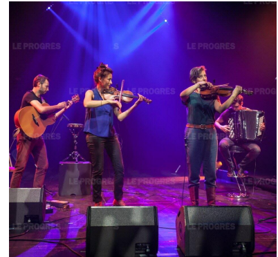
Quatre musiciens ultra-inventifs et furieusement groovy.

et voguent du côté du jazz et des musiques improvisées. Souffle alors un vent de liberté et de modernité sur les musiques d'Europe de l'Est jusqu'aux rives de la Méditerranée. À l'occasion de ce dernier spectacle de la saison, la programmation 2024-2025 sera présentée. ■