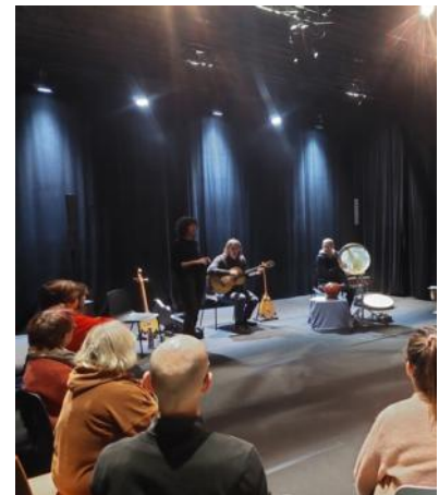
Le trio Meïkhâneh.

Pour y assister, rendez-vous le 7 juin, à 18 h 30, à la MJC Le Sterenn, à Trégunc (+ 6 ans, gratuit, sur réservation au 02 98 50 95 93). D'ici là, le trio Meïkhâne animera trois nouveaux ateliers à la médiathèque de Tourc'h les mercredis 3 avril, 15 mai et 5 juin à 14 h 30 (réservation au 02 98 66 32 38). ■