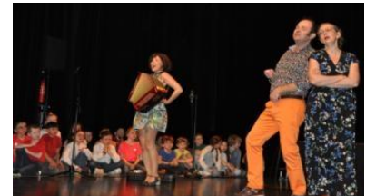
Les élèves avec les artistes de « La Fontaine unplugged ».

sont les maternelles qui seront invitées à se rendre au Family pour le concert de Cristine Merienne : Nicodème. Il s'agit d'un partenariat avec la médiathèque de Landerneau dans le cadre du festival Clair de lune. ■