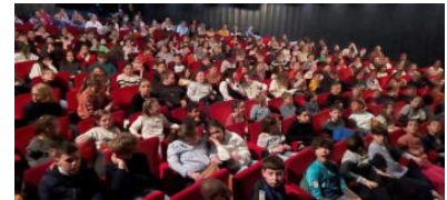
Les élèves du CP au CM2 ont pu profiter du spectacle musical « L'appel du clairon éternel ».

Renseignements. E-mail : jmf.stlo@gmail.com , site internet : http://www.jmfrance.org ■