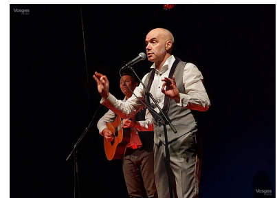
Deux comédiens enthousiasmaient le jeune public du Rio avec le spectacle Pompon organisé par les JMF.

Une tâche ardue nécessitant une organisation lourde et un budget conséquent de 80 000 euros. La 8 e édition du CIVM s'annonce d'ores et déjà grandiose ! ■