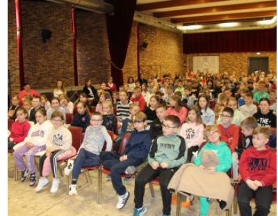
La représentation « Les Trois Jours de la queue du dragon » était présentée à la salle Raymond Dufour.

bable et son acolyte multi-clarinettiste ont livré leurs secrets morphologiques et psychologiques des dragons, s'inspirant de la vie de ces animaux de légende tout en créant une analogie étonnante avec les clarinettes. Par de multiples jeux musicaux sur les dragons et leur imaginaire, les artistes ont embarqué l'auditoire dans une expérience sonore et visuelle pour le moins farfelue. J-F. L. (CLP) ■