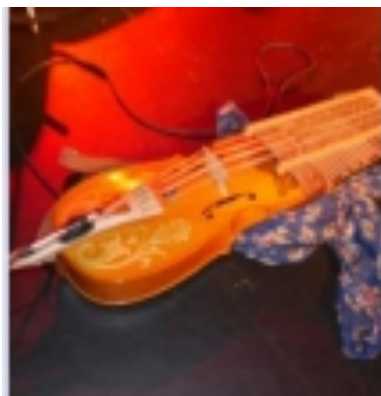
Le nyckelharpa. Le Courrier de l'Eure

Un conte musical qui, pour parler de l'adoption des enfants, parcourt le monde comme un petit oiseau vert grâce au violoncelle, un clavier,