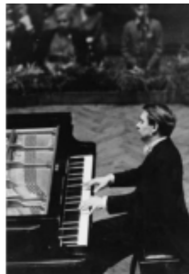
Samson François au Festival de printemps de Prague en 1959.

Le piano avait été acquis de seconde main par la mère de Samson en 1933, alors que la famille vivait à Nice et qu'il était élève au Conservatoire de la ville.