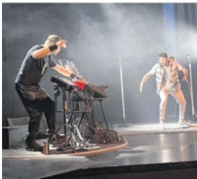
Les JMF sur le secteur des Sables-d'Olonne : 2 300 écoliers assistent à des spectacles de qualité chaque année.

Les Jeunesses Musicales de France fêtent leur 70 e anniversaire cette année aux Sables-d'Olonne. Pour marquer l'événement, un spectacle gratuit et ouvert au grand public est programmé le 4 février prochain au Havre d'Olonne, théâtre de la Licorne.