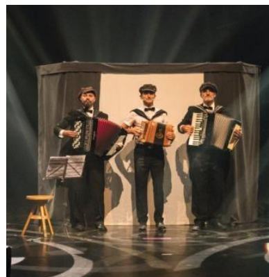
La compagnie In Visu donnera un concert intitulé « Une brève histoire du son ».

Gratuit. Tél. 06 20 32 50 97 ou 06 73 38 18 59. ■