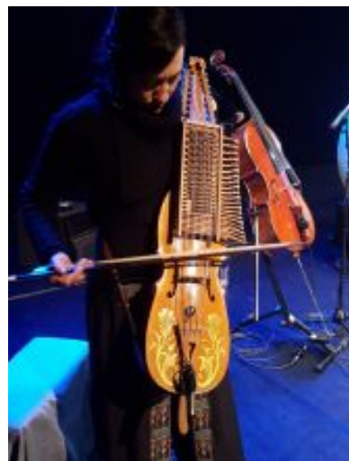
Le jeune public a pu découvrir