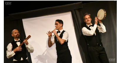
Le trio de la compagnie In Visu a été très apprécié par le public.

nutes. Le trio breton, composé de musiciens, a su captiver le jeune public par une mise en scène rythmée et humoristique, saluée par l'ensemble des spectateurs. ■