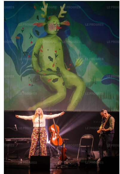
Deux interprètes et un décor immersif.