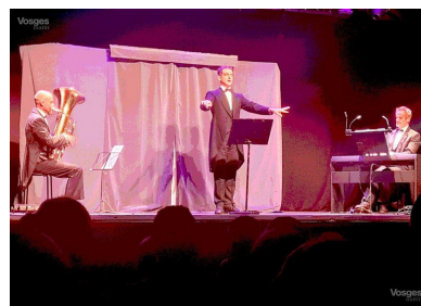
Le trio déjanté de la Compagnie in Visu a retracé l'histoire de la musique... à leur façon.