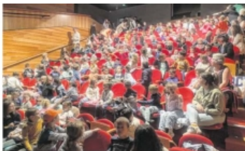
Le jeune public venu nombreux aux six séances proposées par les JMF le 4 et 5 juin.

Les Jeunesses Musicales de France (JMF) ont fait voyager les écoliers entre cinéma, musique et découverte culturelle. Pendant deux journées, les 4 et 5 juin, la délégation des Jeunesses Musicales de France (JMF) de Flers a accueilli plusieurs centaines d'enfants des écoles du territoire pour un ciné-concert original mêlant courts-métrages d'animation iraniens et musique jouée en direct. Six séances ont affiché complet pour ce spectacle