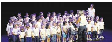
Les élèves en pleine représentation.

Le mois de mai a une nouvelle fois été placé sous le signe de la musique.