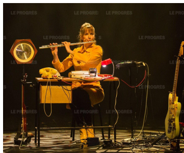
Miss Tweed, à découvrir le 20 novembre. Photo @Thierry Guillaume

▶ Et, pour finir la saison, le 9 avril à 20 heures, trois fins musiciens et joyeux drilles feront entendre une histoire de son, du premier cri à la symphonie. ■