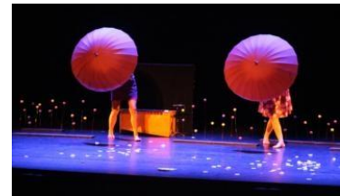
Pour captiver l'attention des jeunes spectateurs, les spectacles sont aussi très visuels.

Plus d'infos sur ces spectacles sur le site des JMF France. Contact : association des Jeunesses musicales de France, antenne de Saint-Lô, courriel : jmf.stlo@gmail.com ■