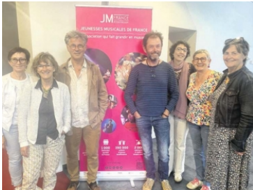
Les sept membres bénévoles des Jeunesses Musicales de France de Flers.